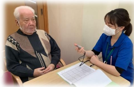
言語聴覚士による評価の様子です♪